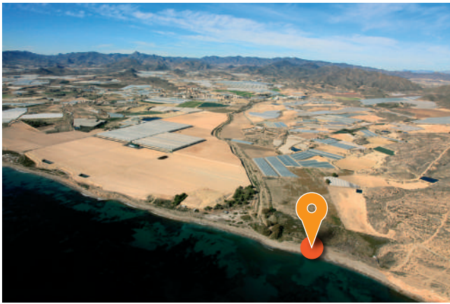
Playa de Las Cobaticas