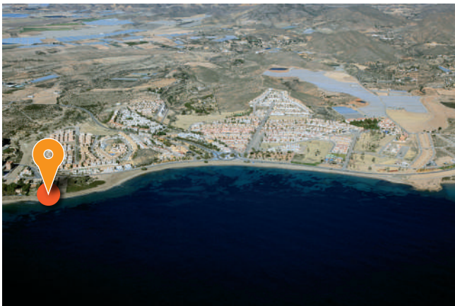
Playa de El Gachero