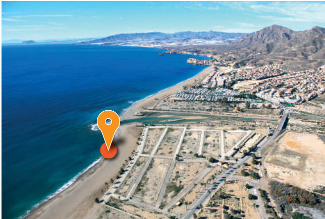
Playa de Las Moreras